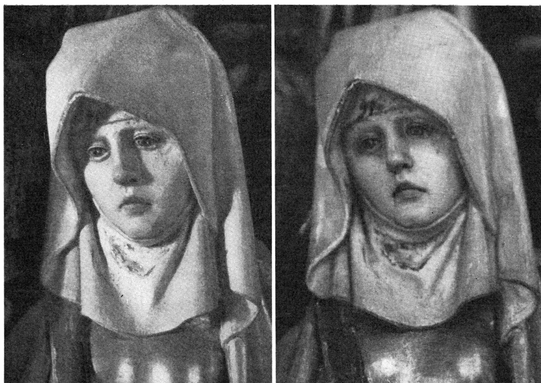
Bild 5-6. Altarskåpsdetalj i två olika tolkningar.

normgivande. Dessa äro i första hand till för att intressera en större allmänhet för konst- och kulturhistoriska aspekter på de svenska kyrkorna.