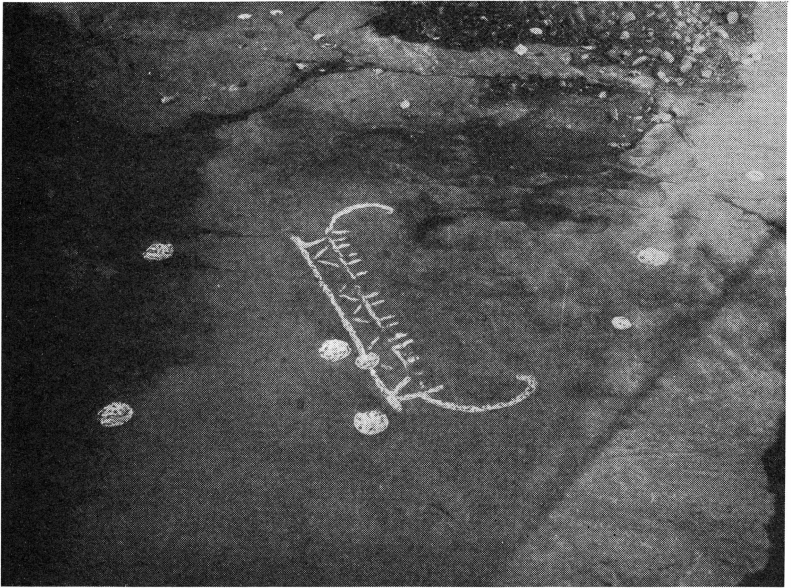
Bild 3. En vacker skeppsristning i Hanningby, Vallby socken.

Ristningen, bild 1 och 2, består av två säkra skepp, det ena av den vanliga typen, längd 0,74 m, det andra, längd 0,88 m, är klumpigt utformat. Ristaren har i detta fall utnyttjat en naturlig försänkning i berget eller en grov glacialrepa. På en liten yta längst åt söder ses ytterligare några figurer, varav en sannolikt skall föreställa ett par fotsulor inom samma ram (figuren liknar en tillplattad cirkel med en längsgående linje i mitten; typen är väl känd från Rickebyristningarna i Boglösa socken). Vidare finnes en cirkelrund figur (solbild?) samt möjligen ett par djurbilder. En mängd älvkvarnar (över 100 st.) äro kringspridda över hela berghällen. Intressant är en grupp av 15 st. miniatyrälvkvarnar, ordnade i tre rader med fem st. i varje rad. Det hela bildar en fullkomligt liksidig rektangel.