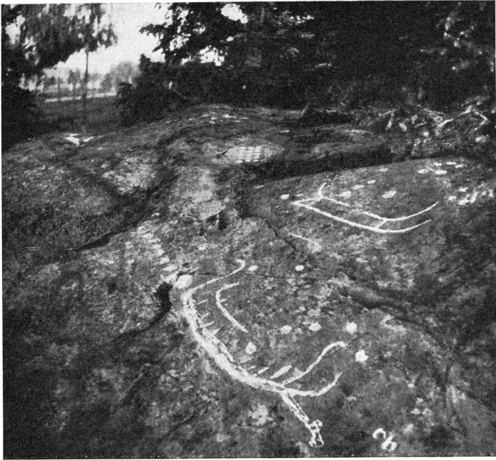
Bild 1. Hällristning i Högby, Långtora socken. Översiktsbild.