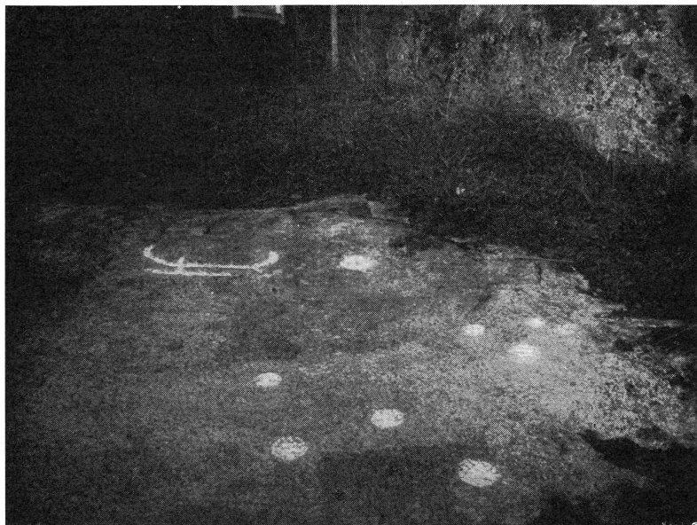
Bild 4. Skepp och älvkvarnar i Finnbo, Litslena socken.

Denna består av ett grunt inristat skepp, längd 0,34 m, samt några älvkvarnar. Berghällen är icke noggrant undersökt, varför flera ristningar kunna finnas.