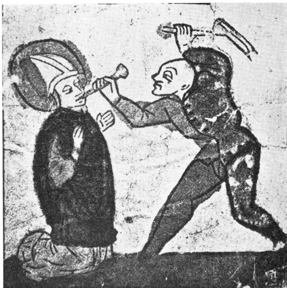
Bild 2. En ikonografisk parallell till scen B. Träsnitt av sydtysk (schwabisk) proveniens.

veniens. Bredvid denna målning och intill fönstret finnes den tredje bilden (C), som tyvärr i stora delar är fragmentarisk. En fullt nöjaktig identifiering av scenen kan därför icke ske. Möjligen kan den avbilda den tronande biskopen, men den torde snarare återge den i Sverige ovanliga bildframställningen av Sankt Erasmus i fängelset. Genom fönstret till vad man kan se som en konstrikt murad byggnad möta vi den helige biskopen sittande i full ornat. Paralleller till denna bild med just Sankt Erasmus äro svåra att finna. Schreiber har i sitt nyssnämnda arbete, pl. 63, reproducerat ett träsnitt, föreställande helgonet i fängelse, vilket dock i detaljer avviker från kyrkmålningen i Tortuna.