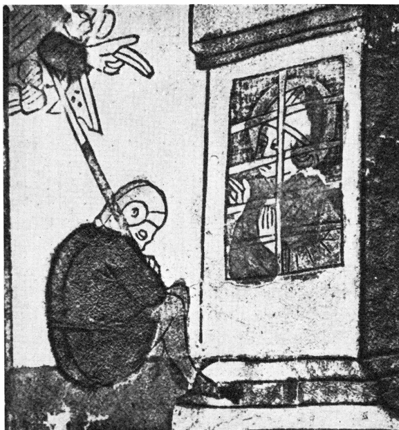
Bild 3. En ikonografisk parallell till scen C. Träsnitt.

ställer helgonets död enligt den äldsta traditionen. Åtminstone två bödlar, en på var sida om grytan, övervaka marteringen, medan en bödelsdräng ligger på knä och underhåller elden under grytan med en pust. Av hela denna scen återstår blott i fragment den ena bödeln, och av drängen med pusten synes blott en fot. Den är dock så placerad, att man förstår, att han måste ha stått på knä. Från uppländsk kyrkokonst kan man nämna paralleller till denna martyrszen i valvmålningarna i Husby-Sjutolft och Tierp (på den senare platsen finnes även tarmvindningsscenen separat).